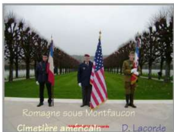
Romagne sous Montfaucon Cimetière américain