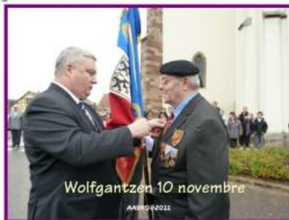
Wolgantzen 10 novembre AA9RG © 2011

Après Volgelsheim le 10 au soir, l'AA9RG était présente avec son drapeau et son