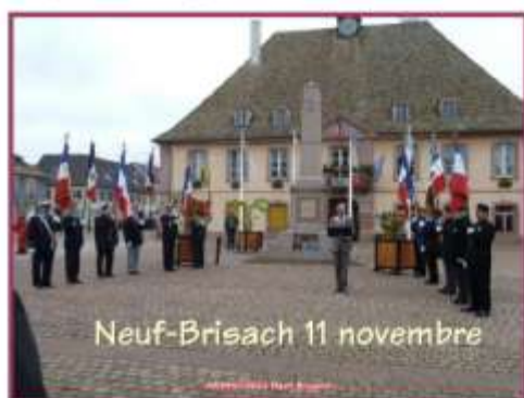
Neuf-Brisach 11 novembre

fanion pour la commémoration du 11 Novembre à Neuf-Brisach.